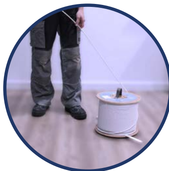
DESENROLLADO BOBINA EK ROLLER