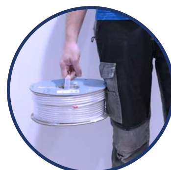
ASA BOBINA EK ROLLER