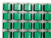
EMBALAJE DE 20 UNIDADES